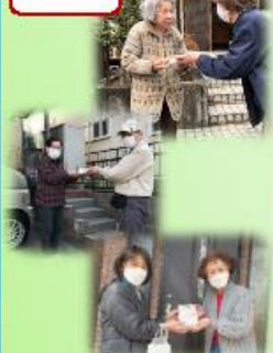
担当地域の委員がそれぞれお伺いします。「お元気ですか？」