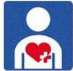
ハートプラスマーク

こんなマークをご存じですか？ 建物や車に貼ってあったり、カバンに付けておられたりします。 外見から分かる困りごと、分からない困りごと、マークを通して気付く事が色々あります。