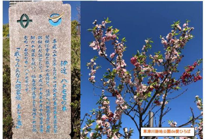
草津川跡地公園de愛ひろば