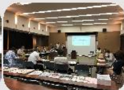
高徳地域包括支援センターと学習会