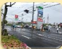
活動強化週間 学区内巡回・通学路の様子