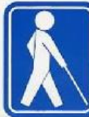
盲人のための国際シンボルマーク

こんなマークをご存じですか？ 建物や車に貼ってあったり、カバンに付けておられたりします。 外見から分かる困りごと、分からない困りごと、マークを通して気付く事が色々あります。