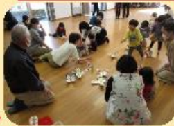
高齢者サロンの方から子育てサロンの子どもたちに牛乳パックで作ったコマをプレゼントにお母さん方も感激！