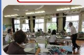
小学校との懇談会