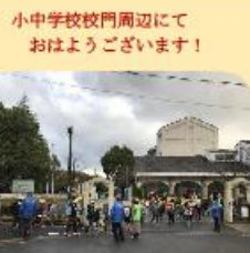
小学校ハートデイ