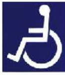
身体障がい者のための国際シンボルマーク