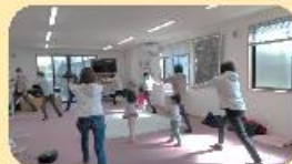
子育てサロンでママもリフレッシュ！