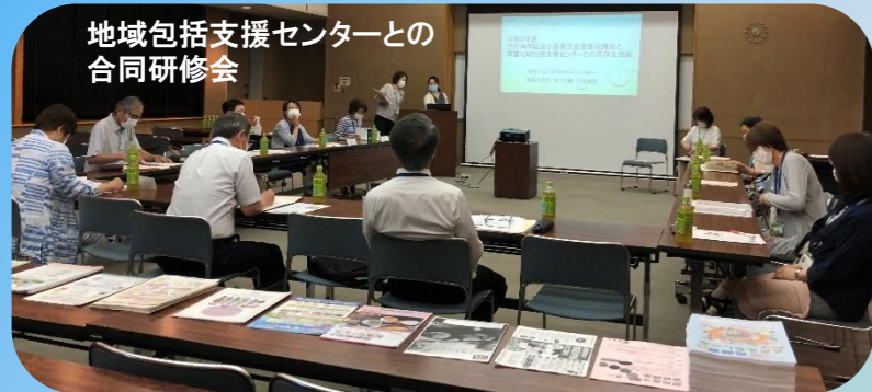
地域包括支援センターとの 合同研修会