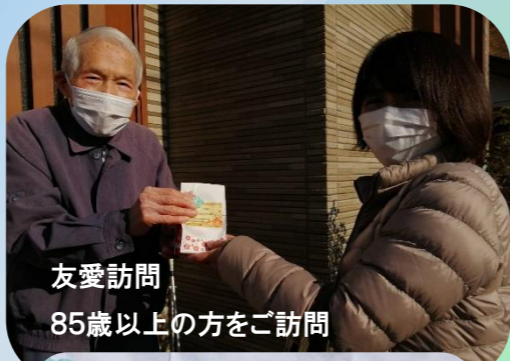
友愛訪問 85歳以上の方をご訪問