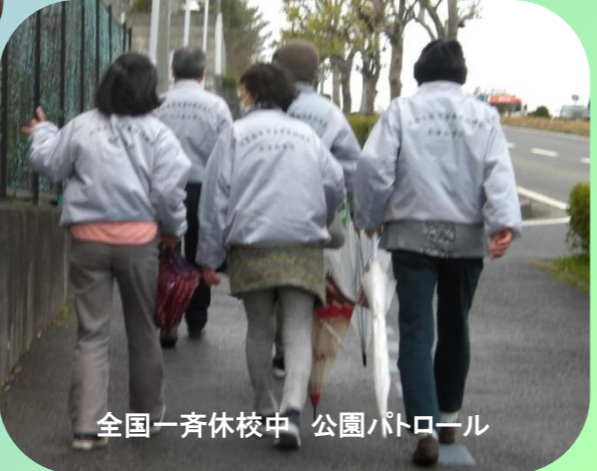
全国一斉休校中 公園パトロール