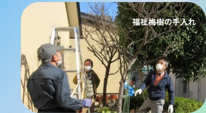
福祉梅樹の手入れ