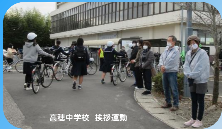
高穂中学校 挨拶運動