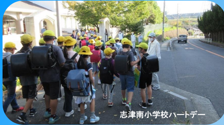
志津南小学校ハートデー