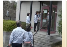
第2にこに子の玄関先 (学外学童保育施設)

小学校では、昼間保護者がおられない1年生から3年生60名程が、登校して学習したり遊んだり…学童保育が始まる15時過ぎからはそれぞれの学童保育へ移動し、保護者のお迎えまで過ごすとのお話しでした。高学年が在籍している学外学童保育は午前中から受け入れ、午後指導員が低学年を小学校に迎えに来られ、合流し一緒に過ごしていました。これからは志津南学区民生委員児童委員協議会では、小学校・学童保育・地域の皆様と連携し、子どもたちが安全に健やかに成長できるよう見守り活動を続けていきます。