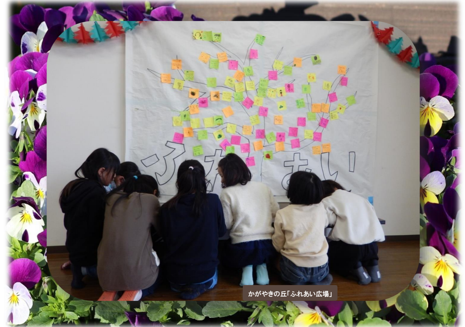
かがやきの丘「ふれあい広場」